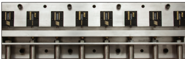
Dauertests verschiedener Zyklusähler durch ein unabhängiges Testlabor um deren Standfestigkeit zu untersuchen. Für Testdaten, Videos und mehr benutzen Sie bitte folgenden Link www.procomps.com/CounterView .

Es sind einige "gefälschte" Kopien aufgetreten. Progressive hat zusätzlich zu rechtlichen Schritten diese Zähler durch ein unabhängiges Institut testen lassen. Im Vergleich mit anderen Marken oder solchen mit ähnlichem Design, hat Progressive's CounterView herausragende Ergebnisse erzielt und selbst mit mehr als 3 Millionen Zyklen keinerlei Ausfallerscheinungen gezeigt. Die folgende Grafik zeigt