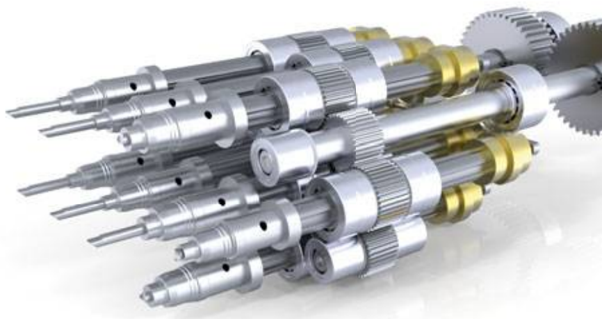
Sonderlösungen – 8fach Ausschraubeinheit – SAM020 Special solutions – 8x unscrewing device – SAM020

Dies erlaubt uns gleichzeitig, auf bewährte Komponenten zurückzugreifen und somit ein 100% sicher funktionierendes Gesamtsystem zu realisieren.