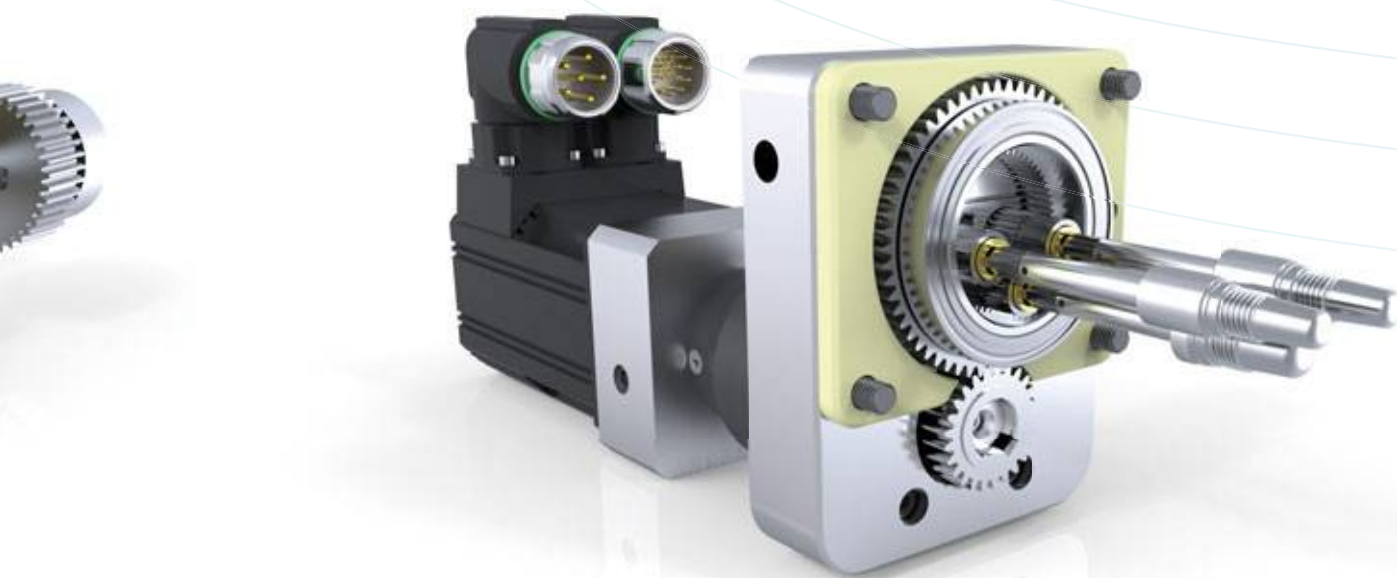
Sonderlösungen – 3fach Ausschraubeinheit „Hohlrad“ Special solutions – 3x unscrewing device „hollow wheel“

Often, standard components are brought into use, which are supplemented by special components. This allows us at the same time to use proven standards and thus to realize a 100% safe functioning system.